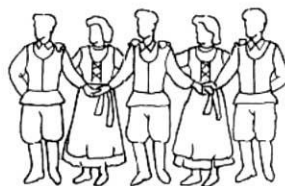
Hvat ispred - ženske šake na ramenima muškaraca