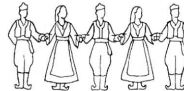
Hvat za šake, savijeni laktovi