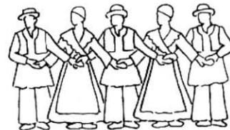
Ukršten hvat ispred (leva preko desne)