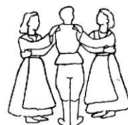
Hvat oko struka - ženske šake na ramenu