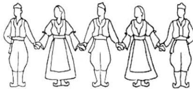
Hvat za šake "dole"