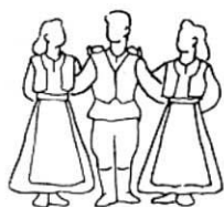
Trojka - hvat iza leđa, ženska šaka na ramenu