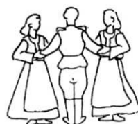
Hvat oko struka - ženska šaka na ramenu i za ruku