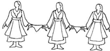
Držanje za marame (posredno držanje)