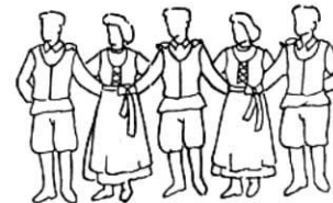
Hvat iza - ženske šake iza na ramenima muškarca