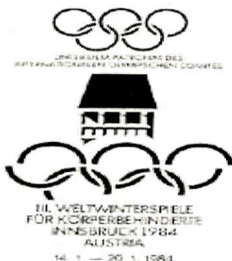
Табела освојених медаља:

Трећа параолимпијада одржана је у Инсбруку у Аустрији 1984. Учествовали су спортисти свих категорија, њих 419 из 22 земље (325 мушкараца и 94 жене). Свечано отварање Игара одржано је 14. јануара и трајале су до 20. јануара. Први пут одржано је егзибиционо такмичење на Олимпијским играма у Сарајеву на коме је учествовало 30 такмичара у алпском скијању у дисциплини велеслалом на три скије. Најуспешнији такмичар био је Немац Рајнхард Милер у алпском скијању, освојивши три злата и једно сребро.