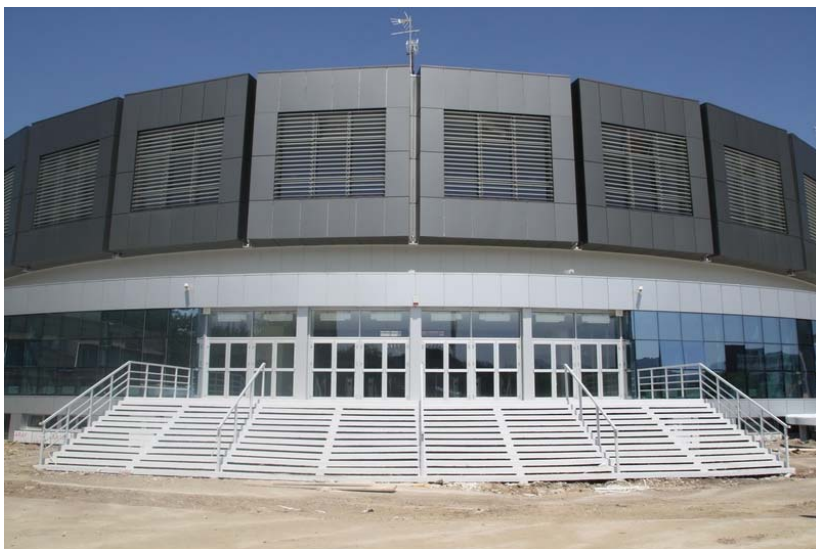
Спортски центар "ЧАИР"

О развијености система образовања најбоље говори статистика: око 50.000 ученика у 32 основне и 21-ој средњој школи и преко 27 хиљада студената Универзитета.