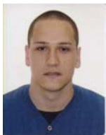
Председник студентског парламента

Седиште студентског парламента је у приземљу зграде Факултета.