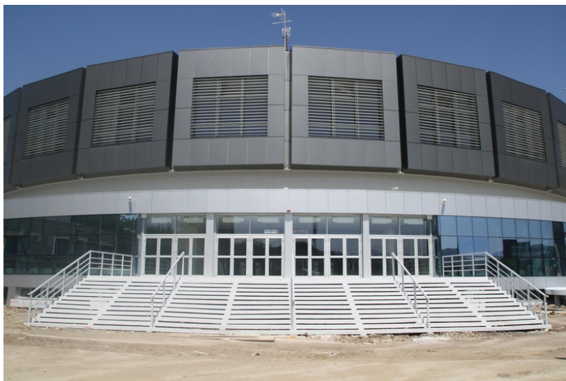
Спортски центар "ЧАИР"

О развијености система образовања најбоље говори статистика: око 50.000 ученика у 32 основне и 21-ој средњој школи и преко 27 хиљада студената Универзитета.